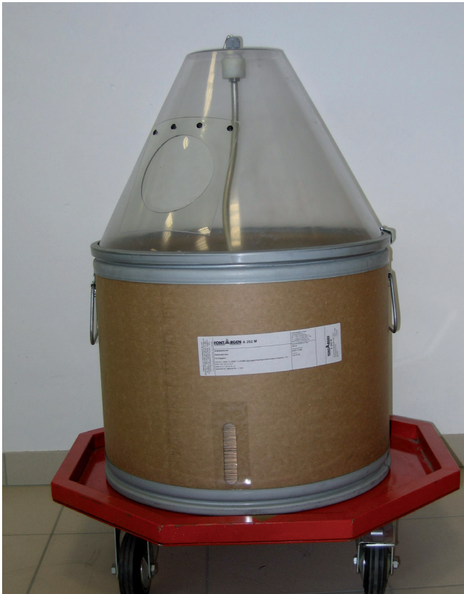
Mini-Fass 100 kg

Sprechen Sie uns bitte an – wir beraten Sie individuell